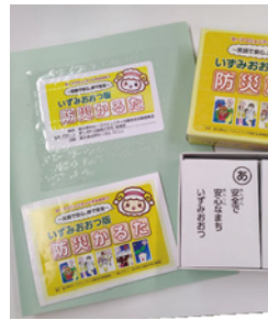
防災かるた・点字版