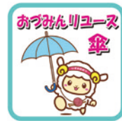
リユース傘設置看板