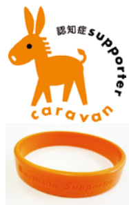
サポーターの証 オレンジリング

申込 6月10日(金)から地域包括支援センター窓口または電話(☎21・0294)