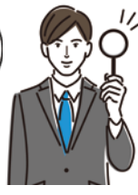
金融業界で働く Bさん