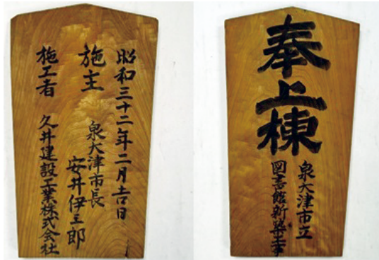
1957年新築時の棟札 (所蔵 泉大津市立図書館)

戦後の文化復興の動きのなかで 1950 (昭和 25) 年に図書館法が制定され、全国的に公立図書館が開館していきませんが、本市立図書館はそれに先駆けた 1949 (昭和 24) 年に市役所分館の一室を利用して開館しました。1952 (昭和 27) 年からは、先進図書館になって日本十進分類法を取り入れた蔵書整理を行うなど、市民がより利用しやすい図書館をめざしました。