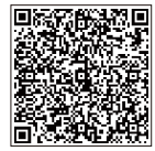
利用開始時期は こちら