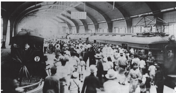
「冷房車両に殺到する乗客(難波駅)」 1936年に導入された冷房車両は乗客が集中乗車するなど好評でしたが、日華事変の激化のために1年で廃止になりました。

開業以来、阪和間の輸送を独占してきた南海鉄道ですが、昭和に入りライバル企業、阪和電気鉄道が登場します。1929年に天王寺～和泉府中間で開業し、翌年には東和歌山まで延伸し全線開業を果たします。南海鉄道が紀州街道沿いの市街地を縫うように走るのに対し、阪和電鉄は熊野街道沿いの農村に直線的な路線を建設、大出力の主電動機を搭載した高性能車両による高速運転を実施し、天王寺～東和歌山間を45分で結びました。これに対抗するため南海鉄道でも大出力の主電動機を搭載した2001形を投入し、難波～和歌山市間の所要時間を60分まで短縮しました。さらに一部編成には日本で初めて冷房装置を搭載するなどサービス面での差別化を図りました。