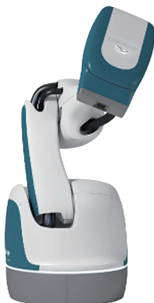
定位放射線治療装置 サイバーナイフ