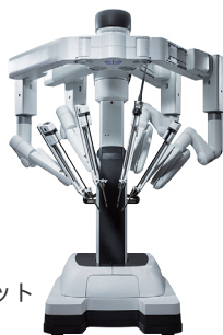
手術支援ロボット ダヴィンチ

手術支援ロボットや高精度放射線治療装置を導入し、精密で体への負担が少ない治療を提供します。また、外来化学療法室を完備し、手術、放射線治療、化学療法を組み合わせた集学的治療を行います。生活の質を維持しながら安心して治療を受けられる体制を整え、多職種チームでサポートします。