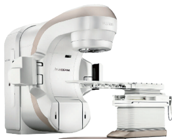
高精度放射線治療装置 トゥルービーム