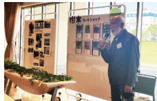
講座・ワークショップ