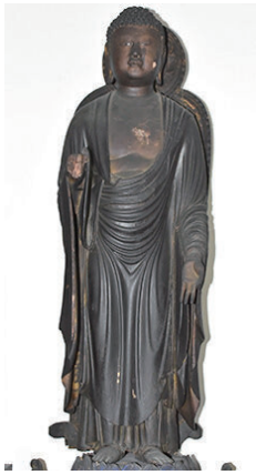
木造阿弥陀如来立像 (安楽寺蔵)