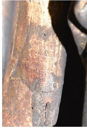
右袖の内側に残る截金

安楽寺(本町)の開基については明らかになっていませんが、少なくとも安土桃山時代までさかのぼることができる由緒ある寺院です。本尊である阿弥陀如来坐像の左脇に安置されているこの像は、ヒノキ材の寄木造で作られ、玉眼(目を本物らしく見せるために水晶の板をはめ込む技法)が施されています。現在は黒漆塗りですが、本来は漆箔仕上げ(漆を塗った上に金箔を押し出す技法)であったと考えられます。右袖の内側には、截金(細く切った金箔を並べて模様を作る技法)で精巧な「変わり斜格子文」が残されており、本来は衣の表面にも截金が施されていた可能性があります。