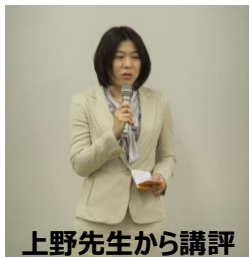
上野先生から講評