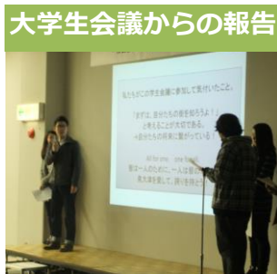
大学生会議からの報告