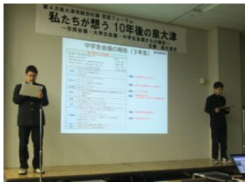
中学生会議からの報告