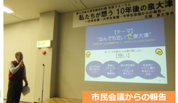
市民会議からの報告