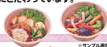
※サンプル画像となります

家庭料理のおいしさを再現するために、防腐剤などの合成保存料を極力使用せず、自然なおいしさにこだわっています。