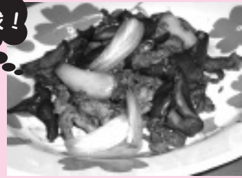
好みて赤トウガラシを加えてピリ辛にしても。 1人分あたりエネルギー…150kcal 塩分…0.9g

《作り方》①豚肉は適当な大きさに切って酒をまぶす。②ピーマンも一口大に、ラッキョウもうすめにスライスする。③フライパンに油を熱し、豚肉を炒める。④豚肉の色が変わったら、ピーマンとラッキョウを加えて炒める。⑤調味料を加えて、全体に味がなじんだらできあがり。