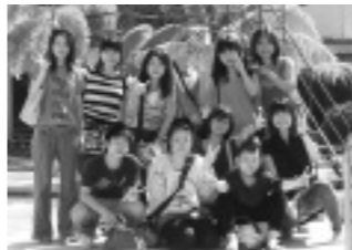
授業のようす。少人数のクラスで生きた英語を学習できます

研修のスタートは、文法やスピーキングなどのレベルテスト。このレベルテストによって自分に合ったクラス分けがされ、授業はマンツーマン、グループレッスンなど合計6時間におよびました。クラス終了後は、校内で他国からの研修生らと英語でコミュニケーションをとりながら、スポーツやショッピングを楽しむなど、それぞれ充実した研修期間を過ごしました。