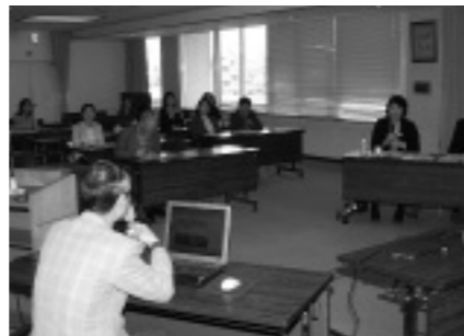
事業報告会のようす