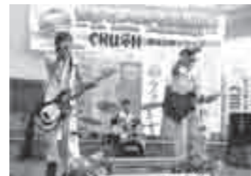
CRUSHチャリティーライブの様子

日時 5月19日(日) 午前11時・午後1時・3時 場所 いずみおつ CITY アルザ 1F アトリウム