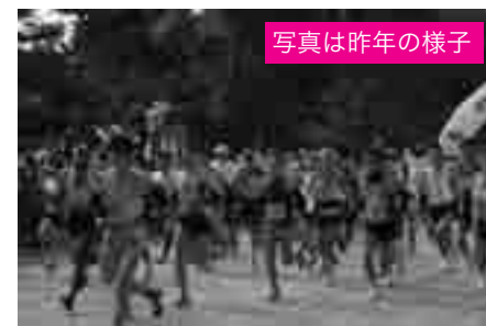
写真は昨年の様子

駅下車すぐ)では、さまざまなイベントが企画されています。 詳細は、泉州国際市民マラソンHPをご覧ください。 ■交通規制にご協力を! マラソン当日は、駐・停車はできません。また、コースにあたる堺阪南線(旧26号線)、泉佐野岩出線などで、午前10時15分~午後3時35分ごろを目安に交通規制が行われますので皆様のご協力をお願いします。 なお、路線バスの南海バス、水鉄バスは、一部運行休止やう回運行します。