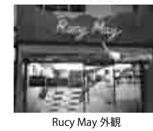
Rucy May 外観