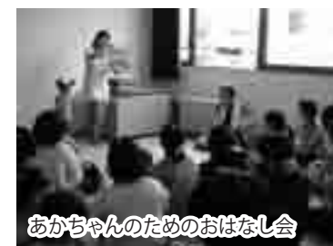
あかちゃんのためのおはなし会