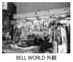
BELL WORLD 外観

乾電池・ボタン電池の回収 (ボタン電池類は水銀を含んでおり、一般の家庭において処理は不可能であり、専門業者が回収後、水銀・鉛を分離し再製品化をしています) 問合 環境課 (市役所2階 21番窓口)