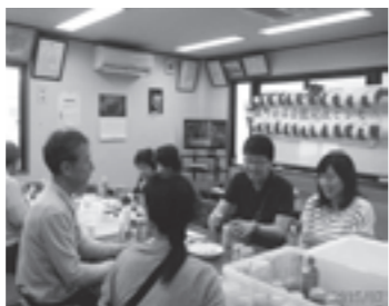
オープニング当日の様子

広報いずみおおつ4月号43ページでお知らせした、「市が契約する施設の利用料金を補助します」について、先着50人に達しましたので今年度の募集を終了します。 問合せ 生涯学習課(市役所3階)