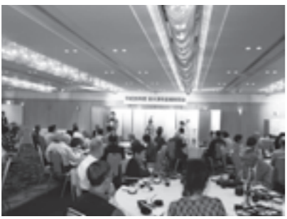
去年の金婚祝賀会の様子

日時 10月1日(木) 午前11時～ 場所 ホテルレイクアルスター アルザ泉大津 対象 昭和39年9月16日～昭和40年9月15日に婚姻した市内在住のご夫婦 申込・問合せ 8月28日(金)までに 印鑑を持参し、高齢介護課(市役所1階6番窓口)へ