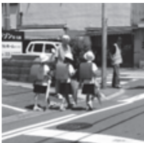
下校時の見守り活動

穴師校区では今年度、子どもや女性を犯罪から守るため、市民ボランティアからなる防犯委員会穴師支部を中心に各種団体、学校、警察、市が連携して、当地区