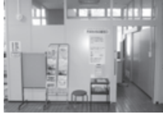
市民生活応援窓口

4月に生活困窮者自立支援制度が開始したことにもない、市役所1階ロビーにて市民生活応援窓口を開設しています。この窓口は皆さんの生活や就労を応援するところで、相談は無料です。支援員がお話をうかがい、どのような支援が必要か一緒に考えて問題解決に向けお手伝いを行いますので、生活にお困りの人・悩みを抱えている人は、まずは気軽に「ご相談ください」。お電話でも結構です。