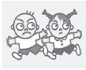
子ども110番ロゴマーク

境を確保するため、「子ども110番」運動を推進しています。もしものときに、子どもたちが助けを求めることができるよう、地域の協力家庭や店が目印となる旗やステッカーを掲げています。学校や家の近くの「子ども110番の家」を探してみましよう。