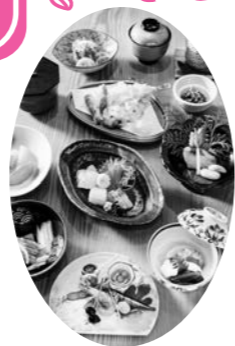
日本料理店「三幸苑」 ふるさと会席ペアご招待券