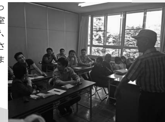
日本語教室の様子