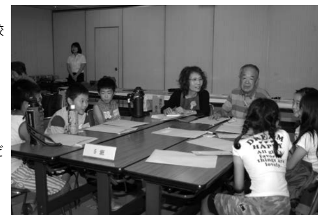
戦争での体験や平和について話し合う様子