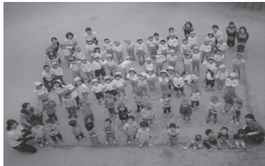
元気かなめっこ、あつまれ~!!