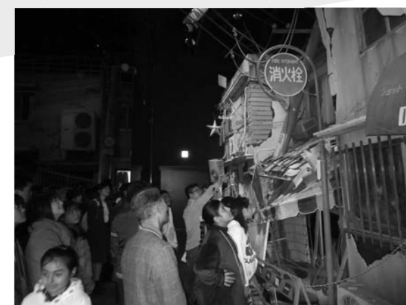
阿倍野防災センターでの防災体験の様子