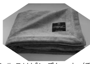
シルクリビングケット(毛羽部分)「レッド、グレー」