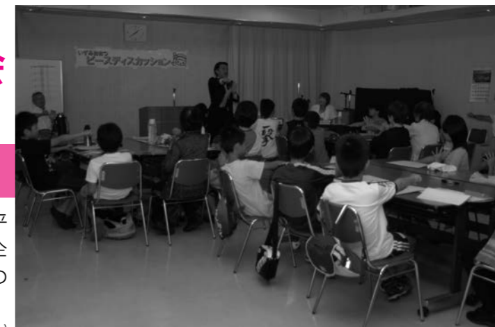
去年のピースディスカッションの様子