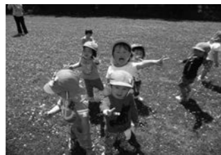
わーい! 広くて気持ちいい♡ (三十合池公園・グラウンドにて)