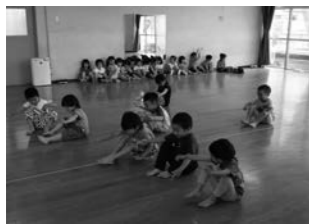
リズム運動 ♪おふねはぎっちらこ~