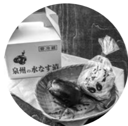
泉州名物水なす漬け