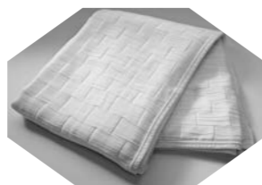
シルク6重ガーゼケット