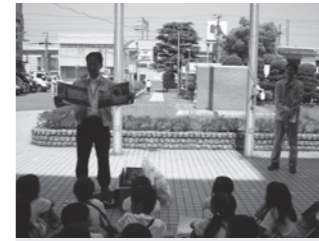
環境のお話真剣に耳を傾ける小学生

4Rを学ぶエコバスツアー 市では4Rを推進しており、4Rに取り組んでいる事業所や施設の見学など環境学習の機会を提供し、循環型社会の構築に向けて、ごみの問題解決への意識啓発を行うものです。 ※この事業は指定ごみ袋の収益を活用して行っています。 ※4Rとは、①いらぬものを断る(Refuse) ②減らす(Reduce) ③繰り返し使う(Reuse) ④再生し利用する(Recycle)の4つのR