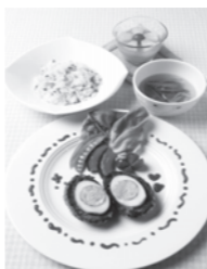
楽しく作ろう！エコして食べよう！夏満載プレート

夏休み親子エコクッキング 旬の野菜を無駄なく使う方法や省エネ、ゴミを出さない環境にやさしい調理の工夫を学びます。 日時 8月3日(水)・5日(金) 両