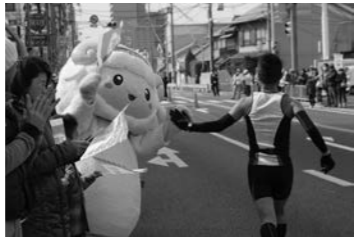
おづみんも沿道で応援!ランナーとハイタッチ!