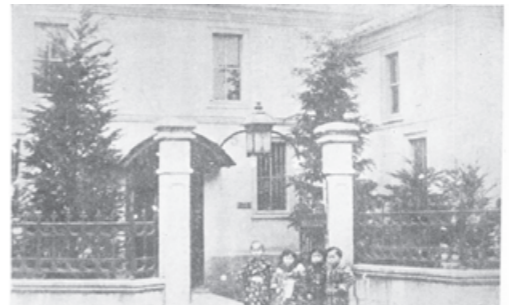
真盛社社屋 (『泉州毛布工業史』より)