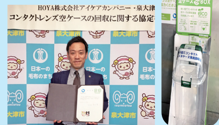
協定調印式はオンラインでおこないました