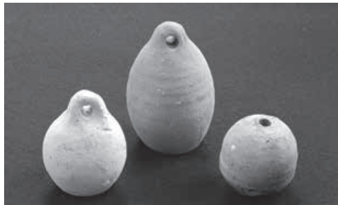
イイダコ壺 (大園遺跡)