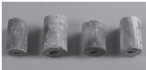
大型化した土錘 どすい (大園遺跡)