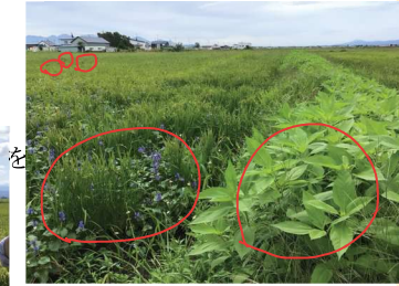
有機栽培一年目 雑草が生えている